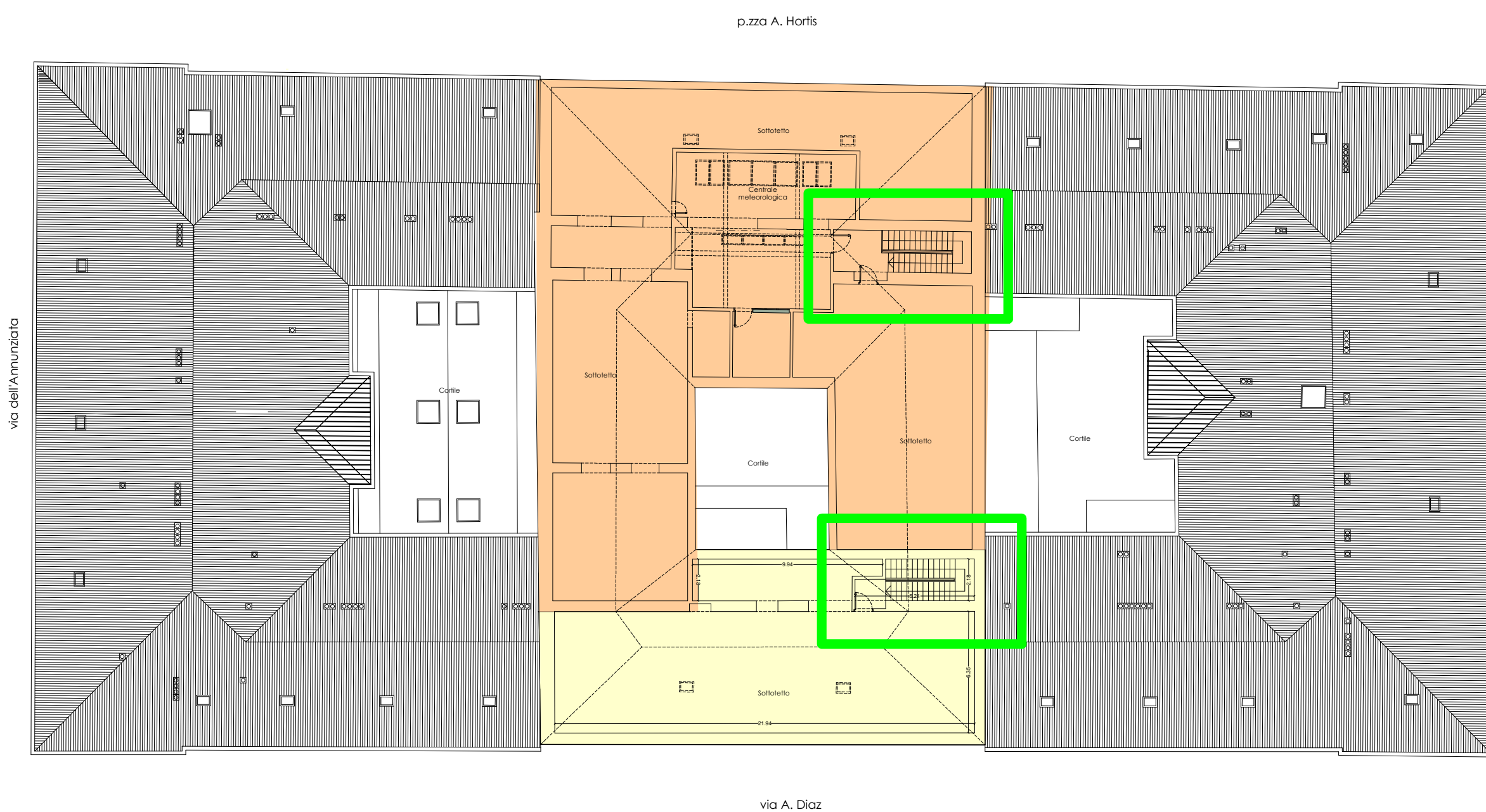
PLANIMETRIA SOTTOTETTO - stato di fatto Individuazione sedi ITC e ITN Scala 1 : 250